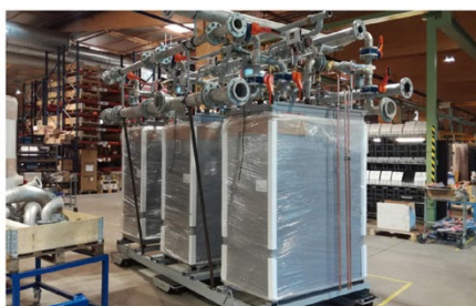
YLEINEN Suomalaisille yrityksille kansainvälinen lämpöpumppualan palkinto Getwell voitti yhdessä Granlundin, Keskon ja Tom Allen Seneran kanssa Euroopan lämpöpumppualan merkittävimmän palkinnon.